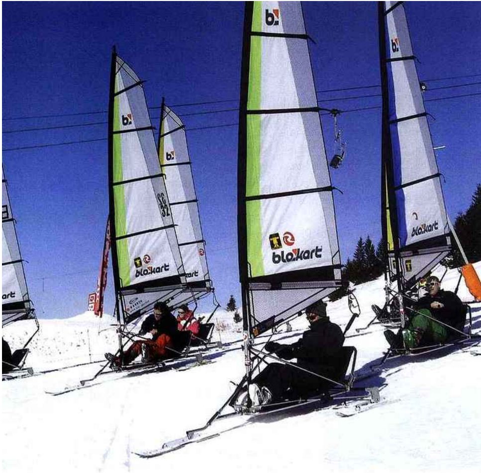
Ci-contre, windsurf des neiges, à Avoriaz.

terrine la plus profonde du monde, avec un dénivelé de 1 733 mètres entre son entrée supérieure (à 2 342 mètres) et le fond de la cavité. Le record de descente y a été battu le 3 février 1998 : 1610 mètres.